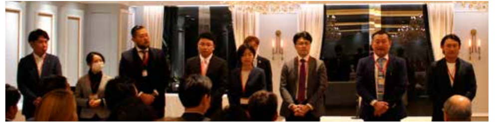
新入会員のみなさま ご活躍を期待しております！