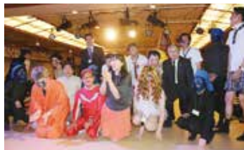
みかねえの誕生日を祝う南レンジャー