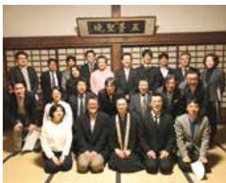
修行部第5回修行座禅の会

それでは、この場をお借りして、ご参加頂きました皆様、関係者の皆様、本堂に有難う御座いました。本紙が発行される頃は、修行部第6回修行滝行の会も充実し執り行われたと思えます。