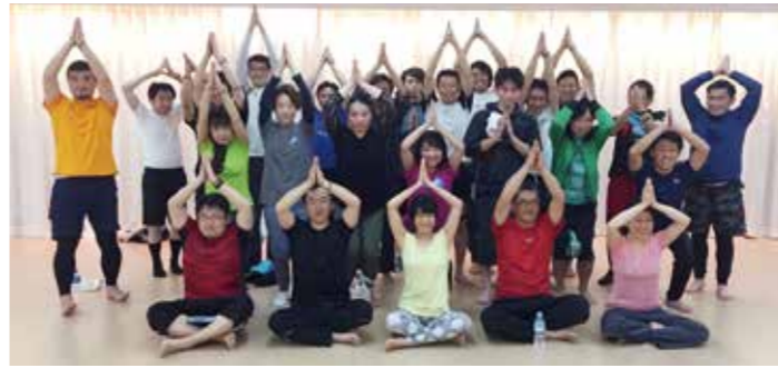
修行部 ヨガの会にて

緊張が途切れてヨガブロックを枕に寝転がったりする人がいる中、休憩が終わるとその姿勢のままヨガの実技へと入りました。先生のご指導